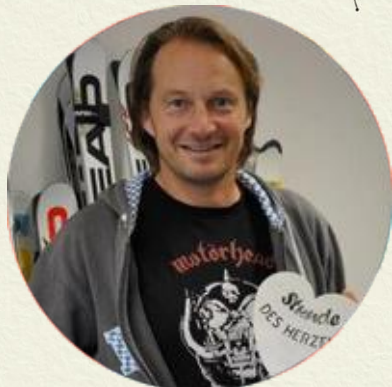
Rainer Salzgeber (53), Ski-Vizeweltmeister und HEAD-Rennsportchef