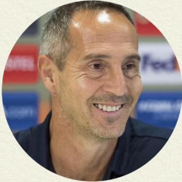
Adi Hütter (50), ehemaliger Fußballprofi und jetzt Trainer von Eintracht Frankfurt

Wer den Mut verloren hat, hat auch das Spiel schon verloren. Also sei mutig und habe keine Angst vor Fehlern oder vor dem Scheitern. Das gehört zum Leben. Bleib dir treu und Versuche immer auch das Gute zu sehen.