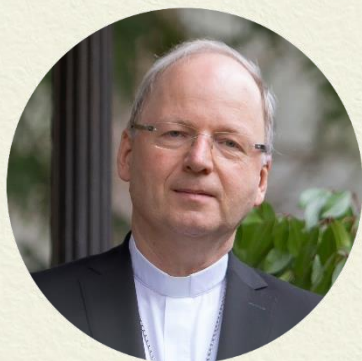
Bischof Benno Elbs