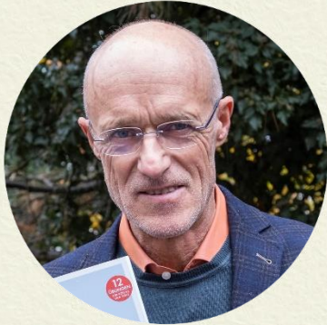
Toni Innauer ehem. Schispringer ehem. Tainer und Sportdirektor ÖSV Autor